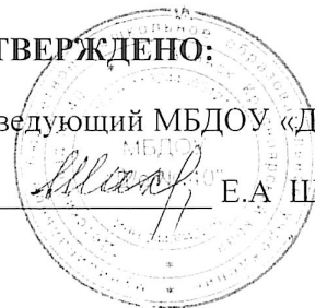
ГРАФИК РАБОТЫ ПСИХОЛОГО-ПЕДАГОГИЧЕСКОГО КОНСИЛИУМА (ППк) МБДОУ «Д/с № 40»