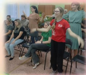
Игра «Голуби летели»