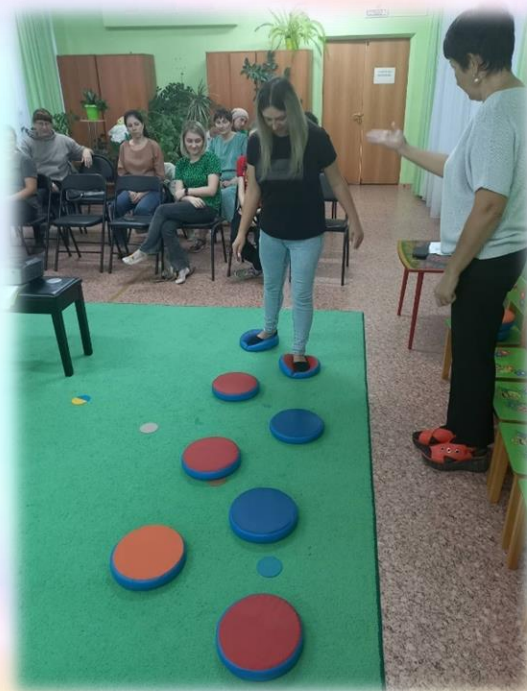
Игра «Звуковая тропинка»