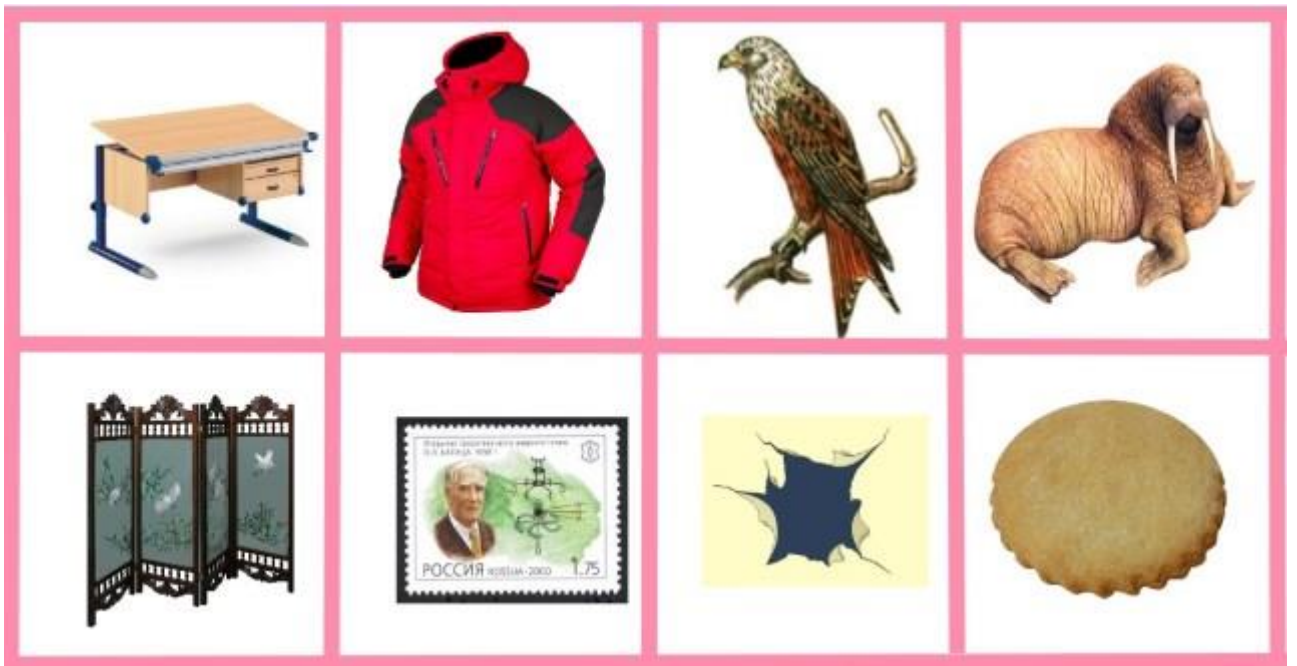
Перечень слов: парта, куртка, коршун, морж, ширма, марка, дырка, корж.