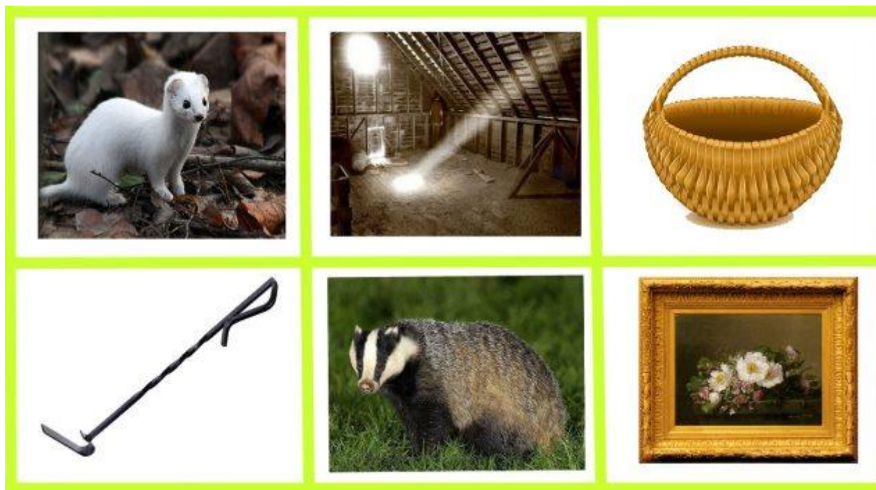
Перечень слов: горноста́й, че́рдак, ко́рзина, кочерга, барсу́к, картина.